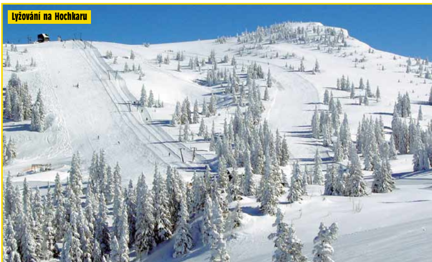
Lyžování na Hochkaru

je nejznámějším střediskem Dolních Rakous s jistotou sněhové pokrývky od prosince do dubna. Perfektně upravované sjezdovky nabízejí vyžití jak začátečníkům, tak pokročilým i náročným lyžařům. Tréninkovou trať zde má i rakouský mistr ve slalomu – T. Sykora. Ke kládům střediska patří moderní přepravní zařízení (včetně kryté čtyřsedačky), které dohromady dopraví až 14.000 lyžařů za hodinu.